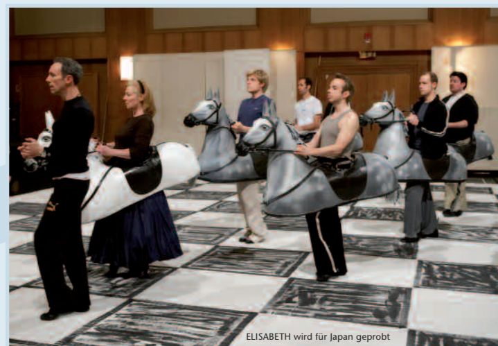
ELISABETH wird für Japan geprobt