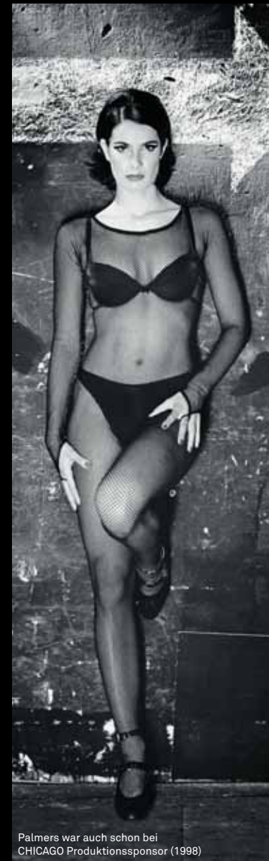
Palmers war auch schon bei CHICAGO Produktionssponsor (1998)

Welcher deiner gesungenen Lieder ist dein Favorit und warum? Ich hab leider noch keinen