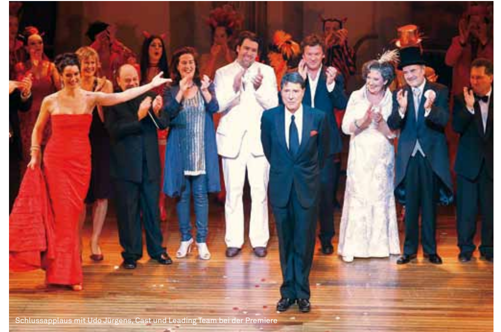
Schlussapplaus mit Udo Jürgens, Cast und Leading Team bei der Premiere