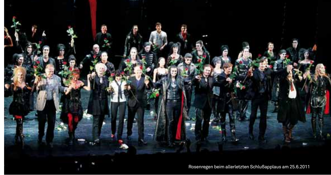
Rosenregen beim allerletzten Schlußapplaus am 25.6.2011

Das Geheimnis der Schauspielerei ist meines Erachtens nach, dass man in jeder Rolle Parallelen finden kann. Als Darsteller aber vor allem auch als Zuschauer. Irgendwo steckt in jedem ein Alfred, eine Sarah, ein Graf Krocklock oder ein Professor – wenn man genau hinsieht. Ein junger Mann, der sich für die Liebe ins Leben wirft, eine junge Frau die Sehnsucht hat, etwas zu erleben, was sie noch nicht kennt, ein gefühlslerner, lebensmüder Mensch, der so leidenschaftlich nach einem Sinn seines Daseins sucht, ein wissbegieriger, neugieriger Charakter, der einem großen Geheimnis auf die Schliche kommen will. Ich